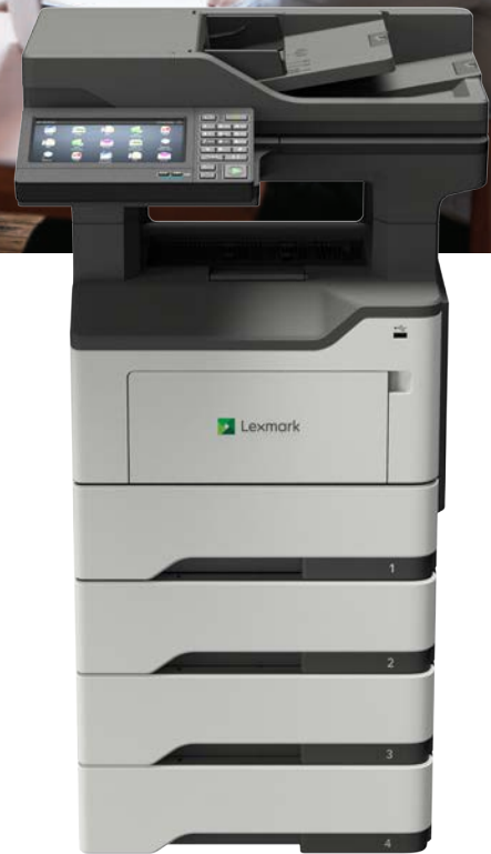
MX622adhe avec bacs d'alimentation en option